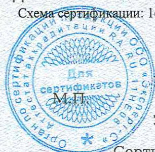
Схема сертификации: Ic